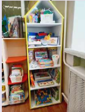
Центр театрализации и музицирования