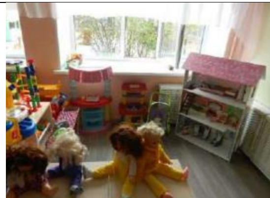
Центр патриотического воспитания