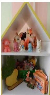
Центр сенсорного развития