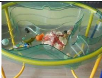
Центр науки и естествознания