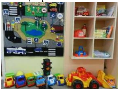
Центр математики и манипулятивных игр

Оборудование: каска, фуражка, пожарные и полицейские машины, макет дороги и светофора полицейский жезл, телефоны -01,02.