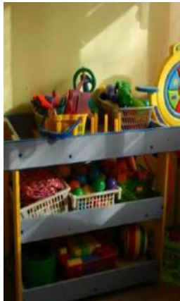
Центр двигательной активности

Оборудован спортивным, оздоровительным оборудованием, инвентарем для двигательной активности и участия в подвижных играх: ленты, мячи, обручи, кольцебросы, кегли, вожжи, картотеки утренней гимнастики, гимнастики после сна, подвижных игр, динамических пауз.