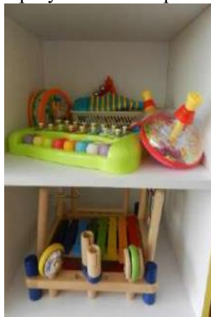
Центр музыкального развития

Оборудование: погремушки, дудки, бубны, барабаны